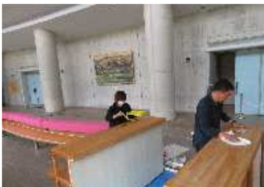
③カウンターリフォーム