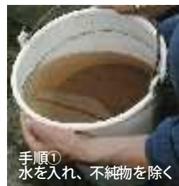
手順① 水を入れ、不純物を除く