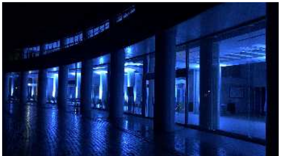
④「ブルーライトアップ」参加

新品のLEDライトを使用し、ホワイエの柱をブルーにライトアップ。夜に美しく映えるよう、ライトの設置場所を工夫したり、青みを微調整したりしました。綺麗なブルーライトで感謝の気持ちを表現できました。