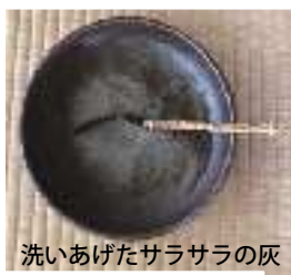
洗いあげたサラサラの灰

茶道では、土用の頃にこの作業を行います。灰は心の鏡であり品格や個性が出るとのこと、毎年行うことで灰を育てるとも言われています。効率や含碳性を求める現在の生活ではなじまないかも知れませんが、私にとっては心を整える一つとなっています。