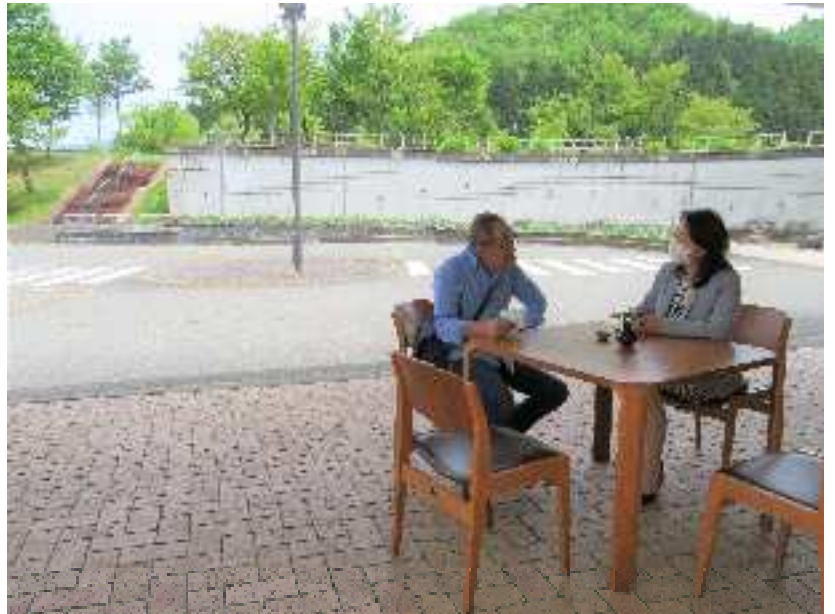
玄関先に応接セットを設置して開放的な空間で打合せ

その間、会館内では収束の折に皆さんが安心して笑顔で当会館に足をお運びいただけるよう「今だから私たちにできること」を合言葉に、様々な準備をしていました。その一部をご紹介します。