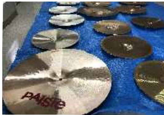
②楽器類のメンテナンス